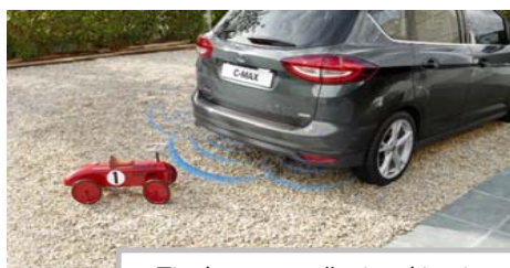
Tipala za pomoč pri parkiranju