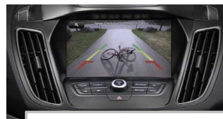
Kamera za pomoč pri vzvratni vožnji