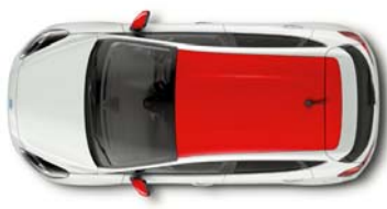
Design paket rdeča streha