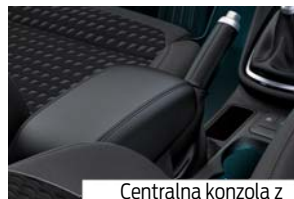
Centralna konzola z naslonom za roke