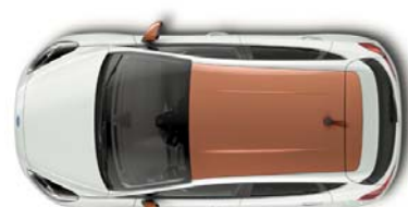
Design paket Chrome Copper