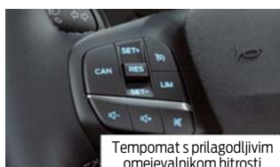
Tempomat s prilagodljivim omejevalnikom hitrosti