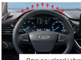
Ogrevan volanski obroč