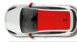
Design paket rdeča streha