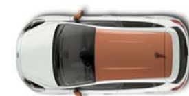
Design paket Chrome Copper

* z ogledali v barvi karoserije ** ni na voljo pri Titanium x - ni na voljo