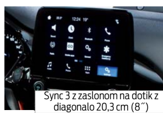
Sync 3 z zaslonom na dotik z diagonalo 20,3 cm (8")