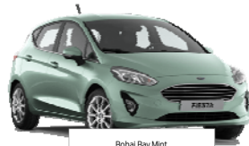
Bohai Bay Mint