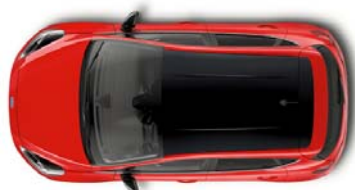
Design paket črna streha