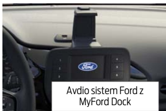
Avdio sistem Ford z MyFord Dock