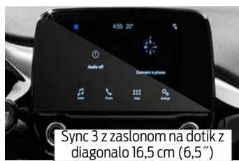
Sync 3 z zaslonom na dotik z diagonalo 16,5 cm (6,5")