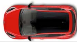
Design paket črna streha