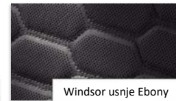
Windsor usnje Ebony