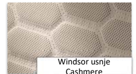
Windsor usnje Cashmere