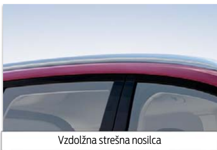
Vzdolžna strešna nosilca