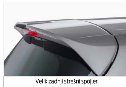
Velik zadnji strešni spojler