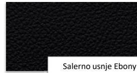
Salerno usnje Ebony