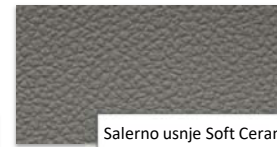
Salerno usnje Soft Ceramic