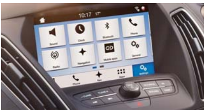
Avdio sistem Ford SYNC 3 z zaslonom na dotik z diagonalo 20,3 cm (8")