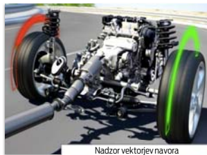
Nadzor vektorjev navora