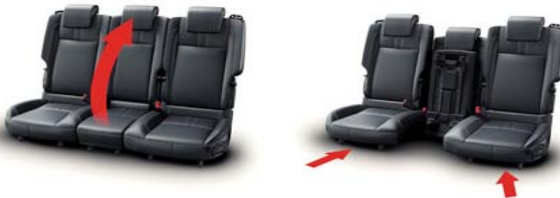
Zadaj sedeži, drsni in poklopni

Vsebujejo 3 posamezne sedeže v drugi vrsti, odstranjive in poklopne. Bočna sedeža na tračnicah pomična diagonalno 100 mm nazaj in 60 mm proti sredini vozila. Set za popravilo prazne pnevmatike (ni na voljo z mini rezervnim kolesom).