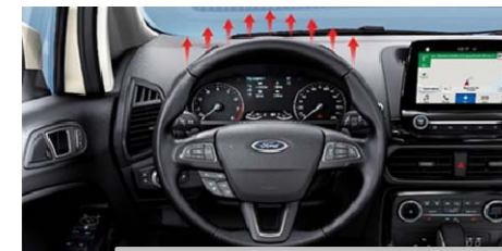
Ogrevan volanski obroč