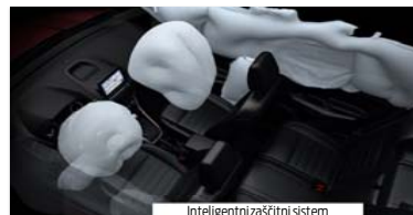
Inteligentni zaščitni sistem

Revolucionarni novi 1,0-litrski 3-valjni bencinski motor EcoBoost vam zagotavlja moč, ki bi jo sicer pričakovali od običajnega 1,6-litrskega motorja, pri tem pa dosega za 24 % manjšo porabo in za 25 % nižje izpuste CO2. Diamantu podobna prevleka na batnih obročkih zmanjšuje trenje; turbopolnilnik, neposredni vbrizg in spremenljiva časovna uskladitev ventilov pa izboljšujejo izkoristek. Rezultat je izjemno varčen motor, ki je že šest let zapored zmagovalec mednarodnih tekmovanj.