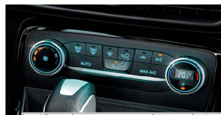
Klimatska naprava s samodejno regulacijo temperature