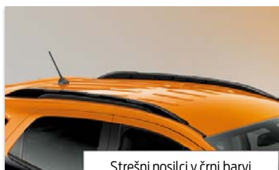
Strešni nosilci v črni barvi