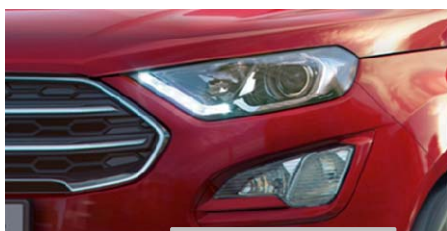
LED dnevne luči