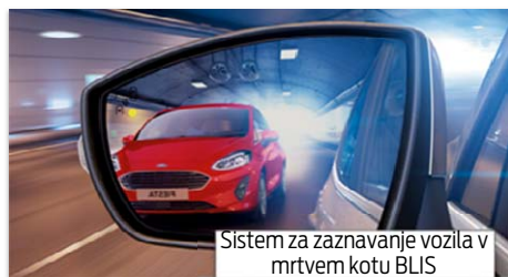
Sistem za zaznavanje vozila v mrtvem kotu BLIS