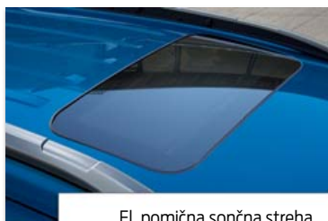
El. pomična sončna streha

Opomba: v primeru, da je streha v kontrastni barvi, je v kontrastni barvi tudi ohišje zunanjih vzvratnih ogledal