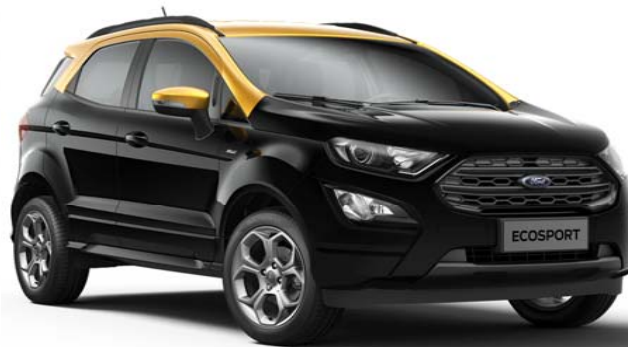
ST-LINE BLACK EDITION