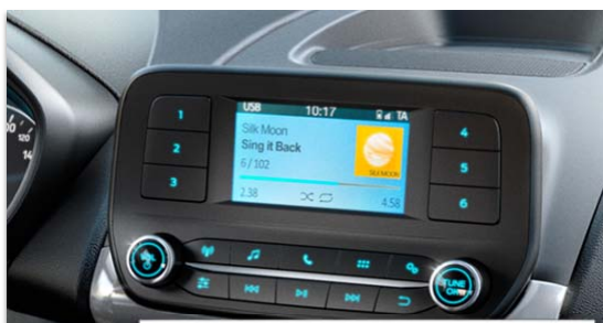
Ford Audio 4,2" TFT zaslon