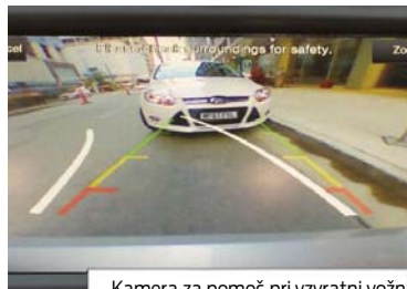
Kamera za pomoč pri vzvratni vožnji