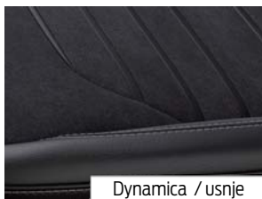
Dynamica / usnje