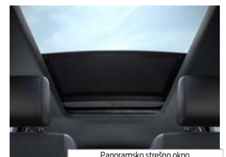
Panoramsko strešno okno