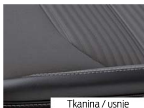
Tkanina / usnje