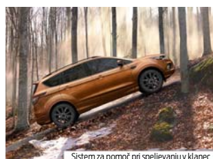
Sistem za pomoč pri speljevanju v klanec