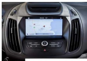
Zaslon na dotik