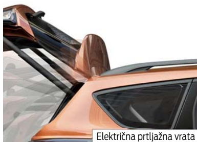
Električna prtljažna vrata