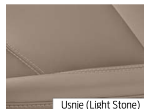
Usnje (Light Stone)