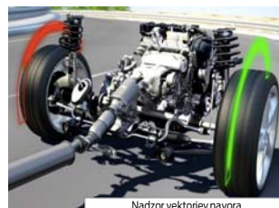
Nadzor vektorjev navora