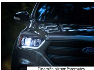
Dinamični sistem žarometov

Nadzor zibanja prikolice zazna vijuganje ali zanašanje prikolice in zmanjša hitrost vozila ter tako pomaga razrešiti težavo in poskrbi za večji nadzor pri vleki. Vozilo upočasni z zmanjševanjem navora motorja in postopnim povečevanjem zavornega tlaka na kolesih.