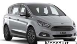
Moon dust Silver