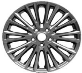
10x2-kraka platišča iz lahke zlitine (Serijska oprema Titanium)