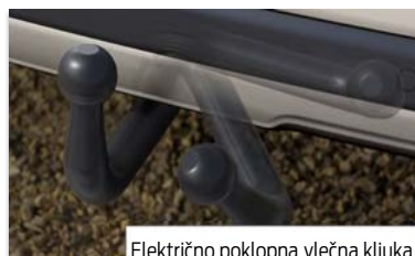
Električno poklopna vlečna kljuka