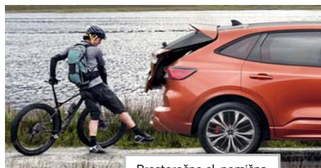
Prostoročno el. pomična prtljažna vrata