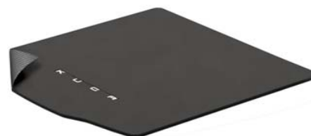
Obojestranski tepih za prtljažni prostor