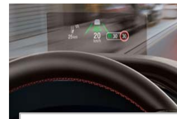
Projekcijski zaslon Head up