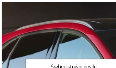
Srebrni strešni nosilci