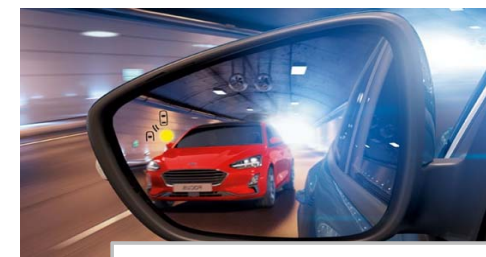
Sistem za zaznavanje mrtvega kota