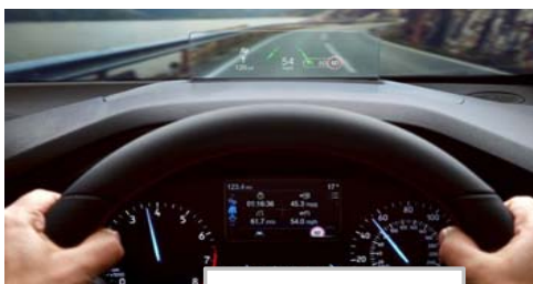
Heads up display