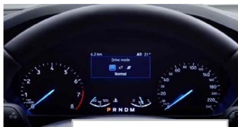
Izbira voznega načina