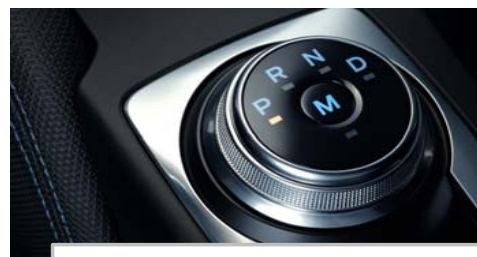
Samodejni 8-stopenjski menjalnik