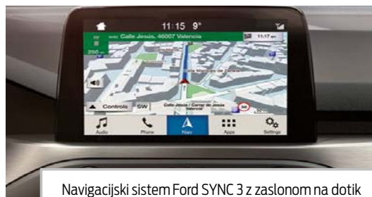
Navigacijski sistem Ford SYNC 3 z zaslonom na dotik