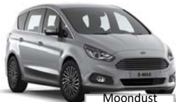
Moon dust Silver