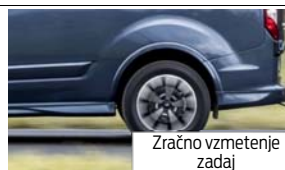
Zračno vzmetenje zadaj