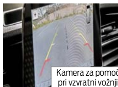
Kamera za pomoč pri vzvratni vožnji

Opomba: Na voljo samo v kombinaciji z Avdlo sistemom 16 ali višje. Ni na voljo z naročilom opreme Halogenskih projektorskih žarometov z LED dnevnimi lučmi (koda JBBBL).