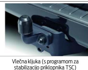
Vlečna kljuka (s programom za stabilizacijo priklopnika TSC)