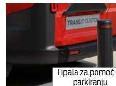
Tipala za pomoč pri parkiranju