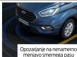
Opozarjanje na nenamerno menjavo smernega pasu