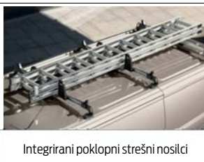
Integrirani poklopni strešni nosilci