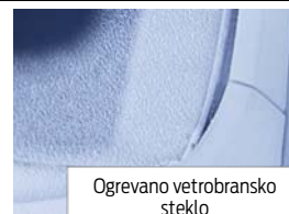
Ogrevano vetrobransko steklo