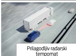
Prilagodljiv radarski tempomat